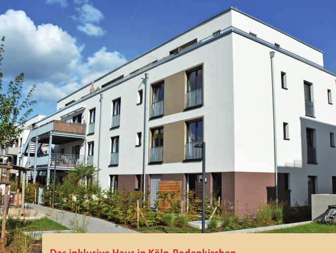
Das inklusive Haus in Köln-Rodenkirchen