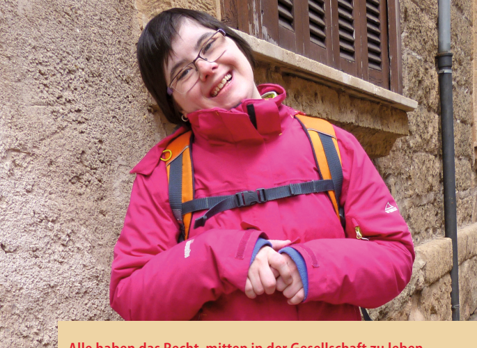
Alle haben das Recht, mitten in der Gesellschaft zu leben