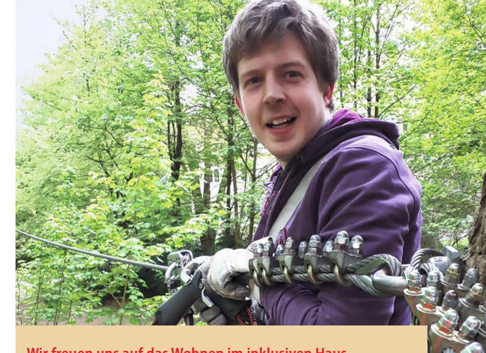
Wir freuen uns auf das Wohnen im inklusiven Haus