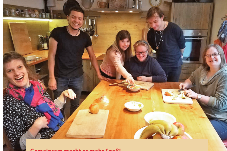
Gemeinsam macht es mehr Spaß!